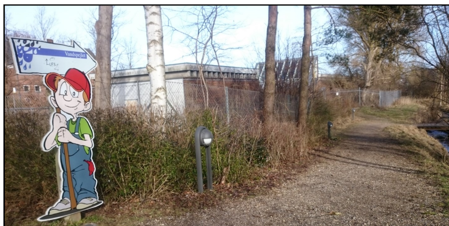
"Vandspejlet" er et fælleskommunalt miljøcenter, som bor på Måløv Renseanlæg. På billedet ses Måløv Renden til højre