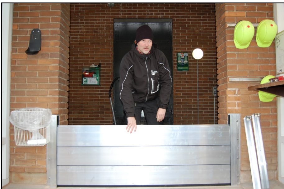
Bag murvingen til venstre er trappen ned til kælderen og al teknikken bag Måløv Renseanlægs indløbspumper