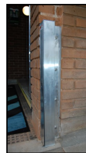
Grundprofilernes gummilister beskyttes i det daglige med en dækplade