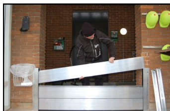
Vandbarrieren er opsat på et par minutter. Derefter er indløbspumpestationen sikret mod oversvømmelse