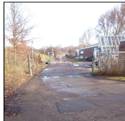
Hovedporten giver fri adgang for Måløv Renden